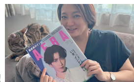
事業の立役者として、アエラの取材を受けました!