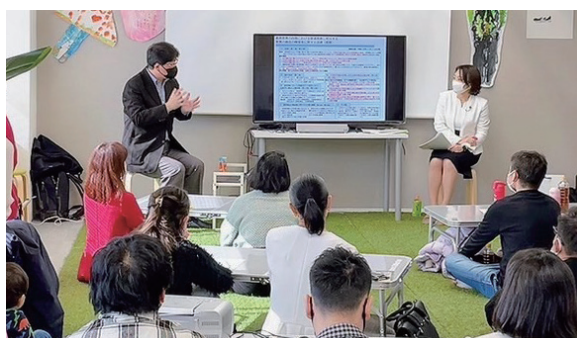
「港区ママの会」を定期的開催

ブログで保護者の声を集め、政策に反映させる「港区ママの会」の活動が評価され、地方政治の活動実績に贈られる「マニフェスト大賞」最優秀賞を受賞しました。