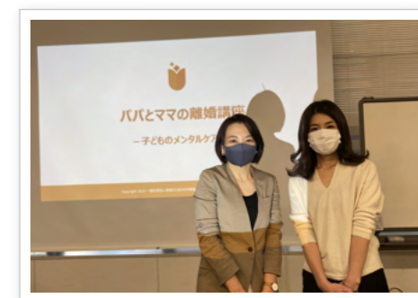
▲リーブラで「離婚講座」スタート