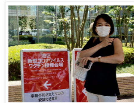
▲東京アメリカンクラブでワクチン接種